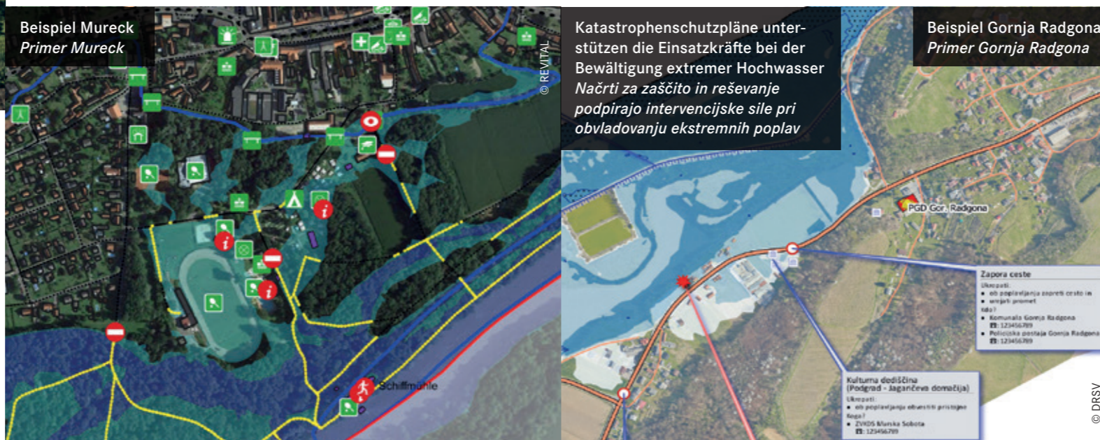
Beispiel Mureck Primer Mureck

Feuerwehr 122 Polizei 133 Rettung 144 Euronotruf 112 Notruf für Gehörlose 0800 133 133